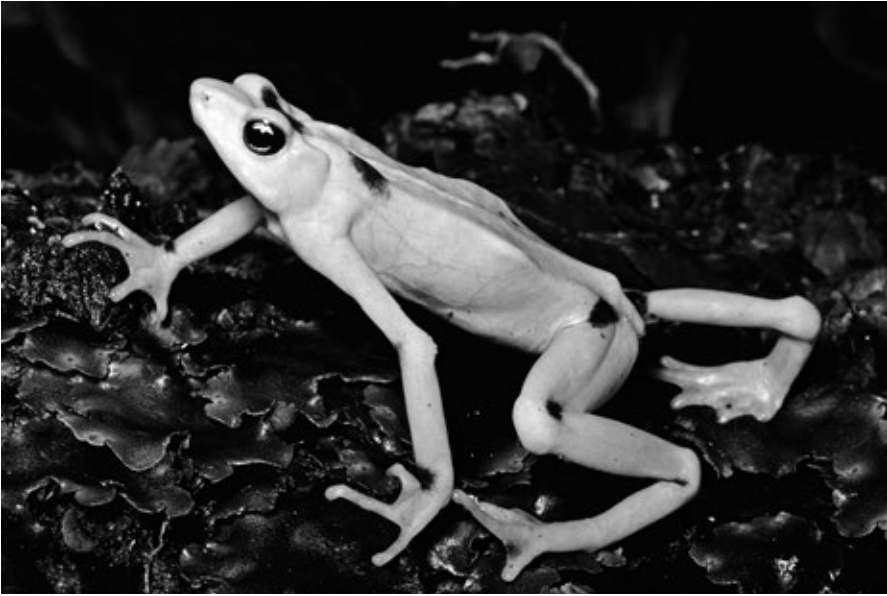
Una rana dorada de Panamá ( Atelopus zeteki ).

o equipo que hayan utilizado en el campo. Al estar sellado, el lugar da la sensación de ser un submarino o, lo que seguramente sea más apropiado, una arca en medio del diluvio.