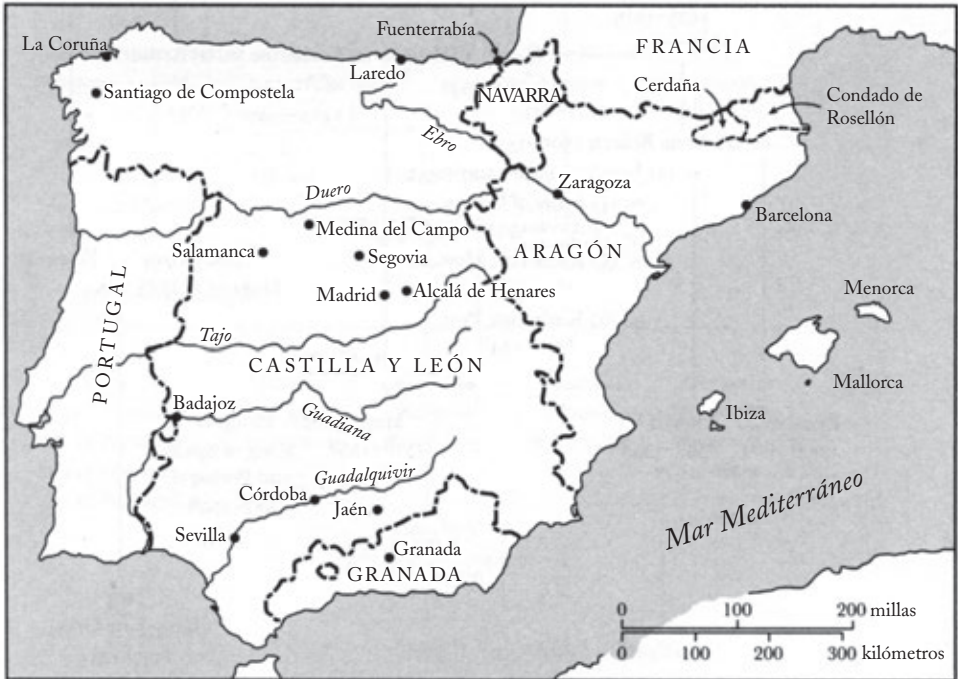
Iberia: reinos y territorios, finales del siglo xv.