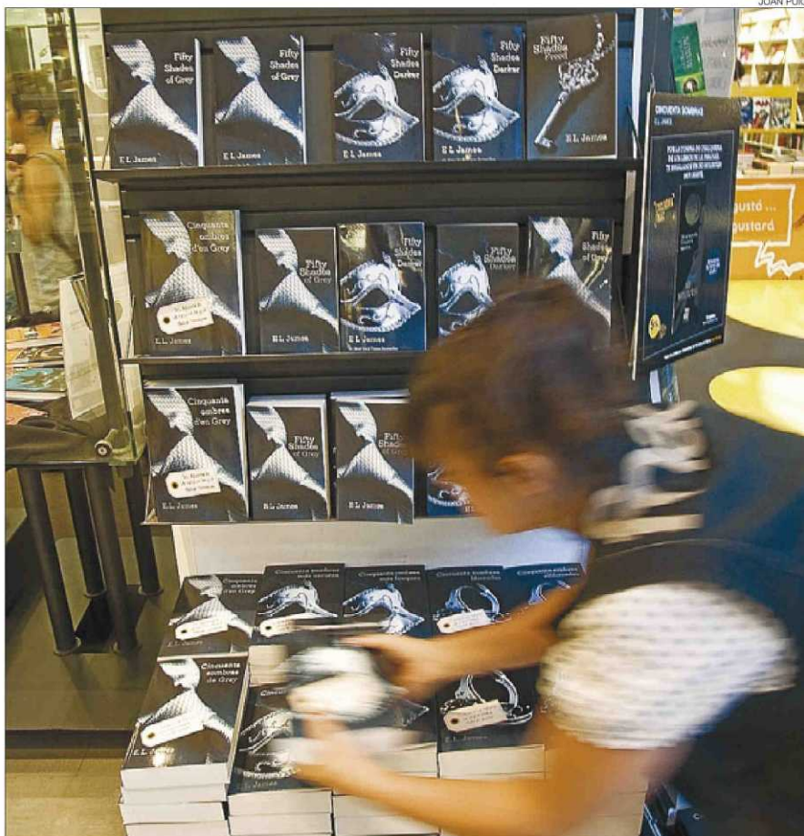
► La trilogía 'Cincuenta sombras de Grey', en el expositor de más vendidos de la Fnac El Triangle, ayer.

EL PLATO FUERTE // El relevo llega esta misma semana y el plato fuerte es No te escondo nada (Espasa / Columna), de la estadounidense Sylvia Day. Es también una trilogía, Crossfire (la segunda parte, antes de fin de año), y los protagonistas, Gideon Cross y Eva Trammel, son también glamurosos, ricos y guapos y están marcados por un pasado oscuro, como en Grey . «Lo que no hay es sumisión ni sado. Buscábamos algo que gustara al mis-