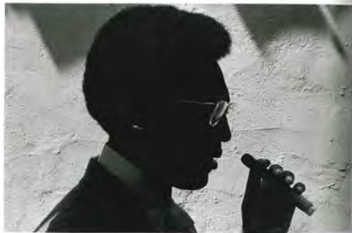
Bill Cosby, Beverly Hills, 1969.

Loengard era un prometedor fotógrafo del Círculo de Harvard cuando, en 1956, JIFE le pidió una imagen de un mercante encallado frente al cabo Cod. La foto no llegó a publicarse, pero el encargo fue el comienzo de una prolongada colaboración. Fue Playboy por un tiempo, y en 1961, cuando los editores quisieron rejuvenecer la plantilla con sangre nueva, lo contrataron. Su suerte era conseguir expresiones naturales en los rostros de los famosos, pero su resistencia impresionó a los soldados en Vietnam: «Una cosa que sorprendió a los [...] veteranos fue su desdén, si no absoluto desprecio por los abundantes peligros noticiosos —decidió un reportero—. La otra cosa fue su aprecio por una cocina que para cualquier recién llegado no solo era inconvertible, sino impensable. El menú, cuando escaseaba otro alimento, consistía en ocasiones en perro, lagarto e incluso ratón». Loengard continuó hasta llegar a séptimo editor gráfico de JIFE . También contribuyó a crear la exitosa People , y fue su primer editor gráfico.