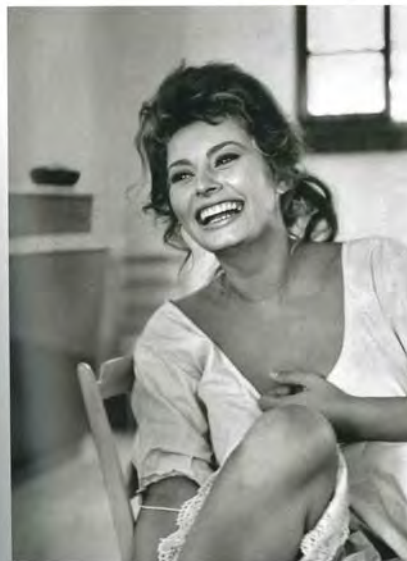
Sophia Loren, 1964.